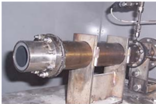
Starchaser hybrid propulsion system