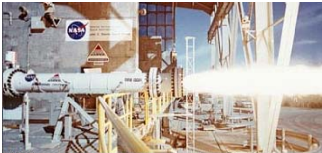
10,000-pound-thrust hybrid rocket motor at test-firing